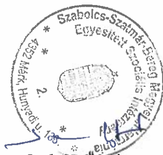
Sarka Béláné intézményvezető

2019. évi költségvetési beszámolójának szöveges indoklása